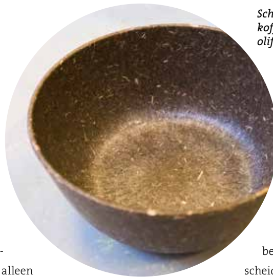
Schaal gemaakt van koffieresidu en olifantsgras